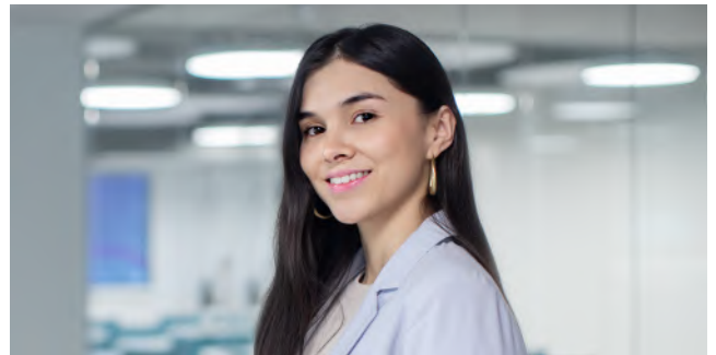
Analista de Servicios Estudiantiles