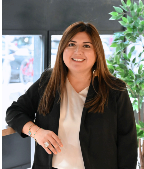
Directora Académica y Servicios Estudiantiles