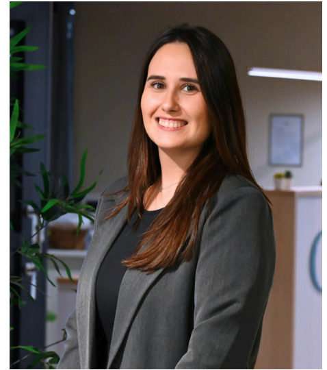
Especialista Programas Académicos