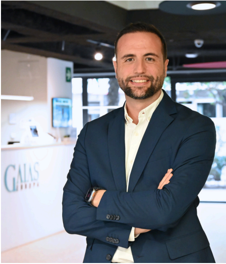
Director GAIAS Europa