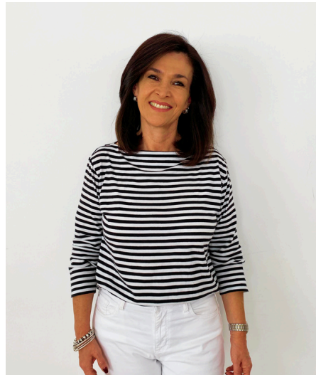
Equipo GAIAS Europa- Quito