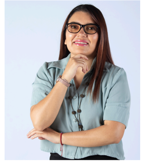
Equipo GAIAS Europa- Quito